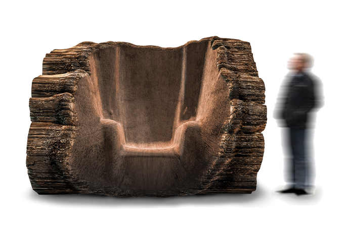
Maarten Baas, The Tree Trunk Chair